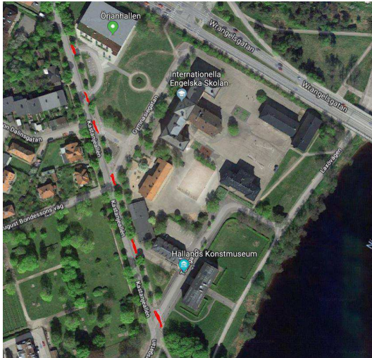
Bild: Potentiellt farliga överfarter markerade i rött på karta ovan